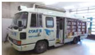
役目を終える「とりんす号」