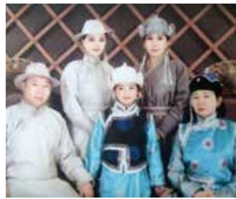
デールを着て家族で記念写真

をします。海外からお祭りを来た皆さんの旅行者が来ます。旅行者には日本人もたくさんいます。それは、現在モンゴル人が日本の相撲で活躍をしていて、モンゴルについてよく知っているからだと思っています。また、モンゴルからは、たくさんの方が日本へ留学しています。私は日本のあいさつの習慣や文化が好きです。特に茶道が好きです。これから、大学か専門学校へ進学して、もっと日本でいろいろなことを学んで、モンゴルの文化を日本に、日本の文化をモンゴルに紹介したいと思っています。鳥栖の皆さん、いつも助けてくれてありがとうございます。これからもお願いします。