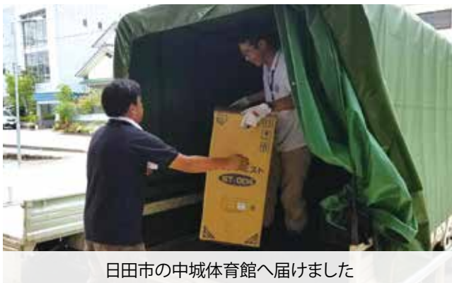
日田市の中城体育館へ届けました