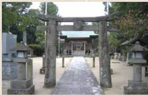
英彦山権現を崇敬していた鍋島直茂によって勧請された轟木日子神社の肥前鳥居

豊臣秀吉による「九州割」により、基肄郡(基山町および田代・基里地区)と養父郡の東地区(鳥栖地区の大部分と麓地区の一部)は小早川隆景領、西地区(鳥栖地区の一部と麓・旭地区)は鍋島直茂領に折半され、その後、前者は対馬藩田代領として成立し、通称「基肄養父」と呼ばれました。後者はそのまま佐賀藩に引き継がれ、石高は江戸時代初期には約5700石と記録に残っています。また、佐賀藩東端の玄関口として、轟木村には「轟木宿」が設置されました。轟木宿は、藩主の参勤や長崎街道の一般の通行はもとより、オランダ人の参府や長崎奉行や肥前西部の大名の通行においても、佐賀藩領入口の主要な宿場として整備され、また藩主専用の宿泊施設である「御茶屋」が設けられていました。享和2(1802)年の記録によれば、轟木宿は人家140軒くらいで宿屋・茶屋が多いとされています。養父半郡には13カ所の村があり、貞享4(1687)年の記録では、人口4089人(男2531人、女1558人)で、男女の比率は約62%が男