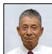
農地利用最適化推進委員