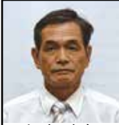
農業委員(会長代理)