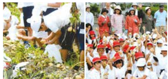
6月のジャガイモ収穫

いろいろな活動の中で「児童との交流」活動もしており、麓小学校の2年生を対象にしたふれあい畑の野菜作りの手助けもしています。5月にはタマネギの収穫、6月にはジャガイモの収穫とサツマイモの苗植え、11月にはサツマイモ掘りにタマネギの苗植えなど1年にわたって活動し、児童と交流しています。収穫の時には袋に多く入れすぎた野菜を両手に持ち、家まで持って帰ることができるかと心配することもあります。児童たちに収穫の喜びを感じてもらっています。