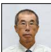
農地利用最適化推進委員