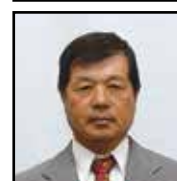
農地利用最適化推進委員