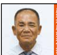
農地利用最適化推進委員