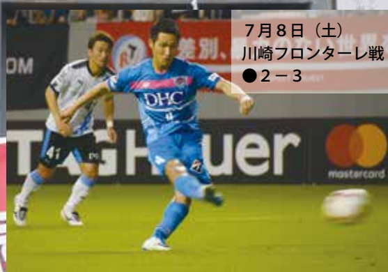
7月8日(土) 川崎フロンターレ戦 ●2-3