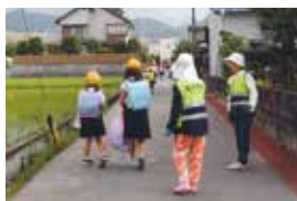
地域の見守り活動

今年、民生委員制度100周年の節目にあたり、さらに住みよい街づくりの一助となるべく活動を進めていきます。皆さんの民生委員制度へのご理解とご協力を心からお願いします。