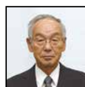
農地利用最適化推進委員