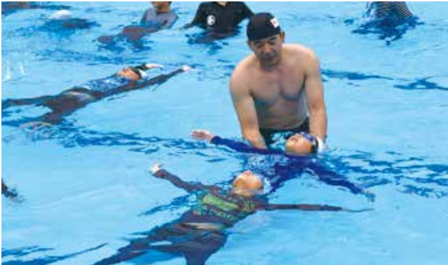
講師から着衣水泳を学ぶ児童たち

水の事故から命を守るための、水上安全法講習会が鳥栖北小学校で行われました。日本赤十字社佐賀県支部の職員が講師として来校。講習会に参加したのは6年生135人。児童は服を着た状態で水面に浮く方法を体験し万が一、海や川に転落した際の対処法を学びました。