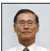
農地利用最適化推進委員