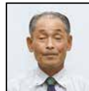
農地利用最適化推進委員