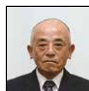
農地利用最適化推進委員