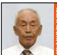
農地利用最適化推進委員