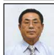
農地利用最適化推進委員