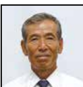
農地利用最適化推進委員