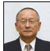
農地利用最適化推進委員