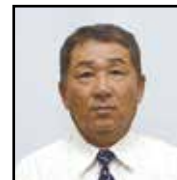
農地利用最適化推進委員