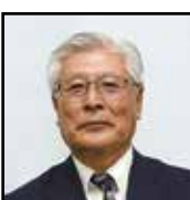
農地利用最適化推進委員