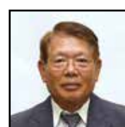
農地利用最適化推進委員