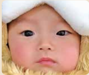
けさまる たいが 袈裟丸 大我くん