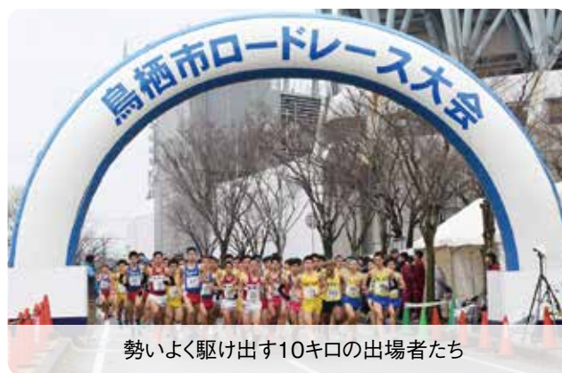
勢いよく駆け出す10キロの出場者たち

鳥栖市ロードレース大会が鳥栖スタジアム周辺で開催されました。子どもからお年寄りまで約1,100人が5キロ、10キロ、ファミリー(2キロ)の16種目に分かれて出場。時折小雨が降る中、力強く新春の鳥栖を走り抜けました。