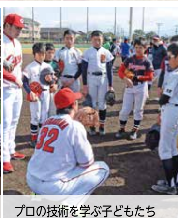
プロの技術を学ぶ子どもたち