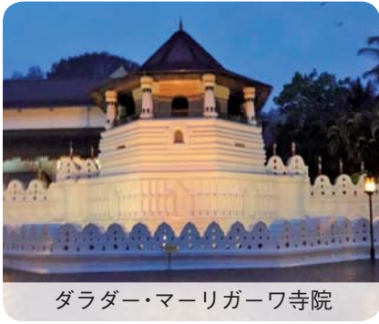
ダラダー・マーリガーワ寺院

鳥栖での生活はもうすぐ2年になります。今まで困ったことがたくさんありましたが、いつも日本人に助けていただいて、とても感謝しています。スリランカは暑い国ですが一年中暑いわけではなく、中央には涼しい所や寒い所もあります。