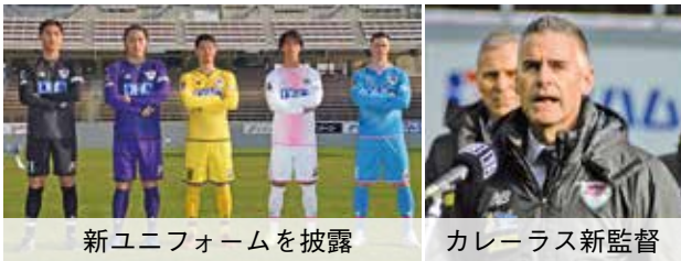
新ユニフォームを披露