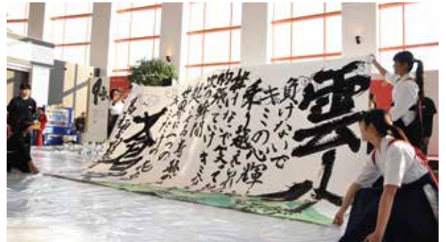
鳥栖高校書道部の作品

また、鳥栖高校、鳥栖商業高校の書道部、鳥栖工業高校の美術部から5チームが未来へのメッセージを書やアートで表現し、会場からは大きな拍手が送られました。