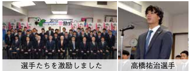
選手たちを激励しました