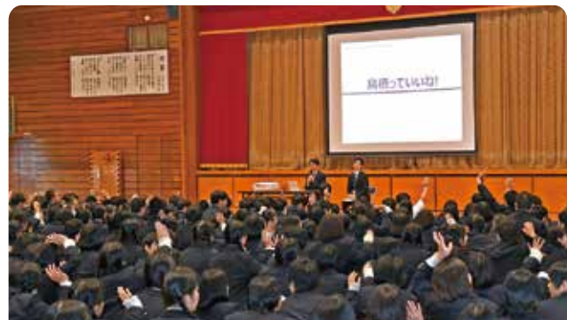
「さがを誇りに思う教育推進事業」の一環として開催

鳥栖市の魅力を紹介する「鳥栖っていいね!」と題した講演会を鳥栖商業高校で行いました。