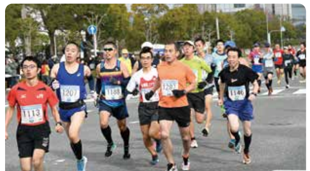
幅広い年代のランナーが鳥栖を駆け抜けました

老若男女の市民ランナーから実力派ランナーまで約1,300人が2キロ、3キロ、5キロ、10キロの各年齢別17種目に分かれて出場。寒空のなか、ランナーが走り抜ける姿に、沿道の観衆からは温かい声援が送られました。