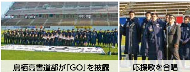
鳥栖高書道部が「GO」を披露