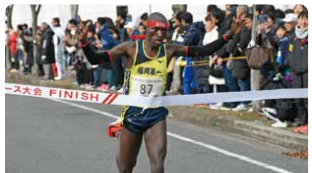
10キロ公認高校生の部で優勝した選手