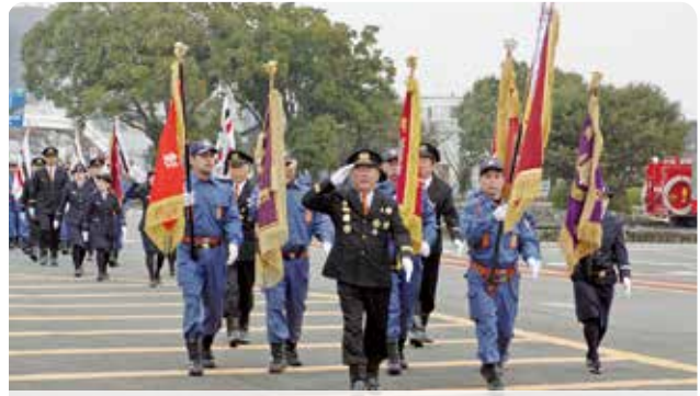
きれいに整列した行進が行われました

令和2年鳥栖市消防出初式が、市役所前広場で行われ、消防団員や消防署職員など約450人が参加しました。市中パレードや分団ごとに行進を行った後、五色放水を披露。色とりどりの放水に観衆からは歓声が上がっていました。その後に行われた式典では、優良消防団員などを表彰。最後に参加者全員で1年間の無火災や安全安心を祈念しました。