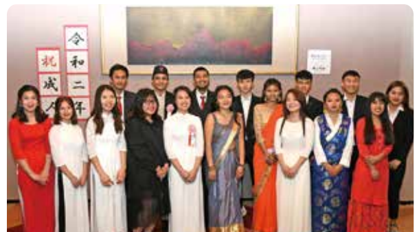
市内の日本語学校に通う留学生の新成人も参加