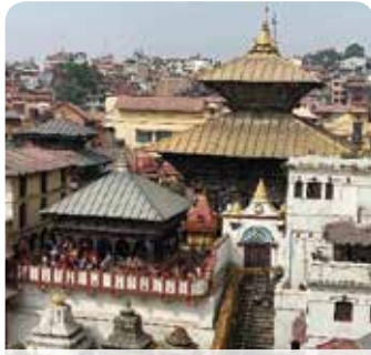
ネパールの寺・バシュパティナート

日本語学校の理事長がいつも学生に「できない、諦めた」と思ったら自分の両親の顔を思い出してください」と言っています。この言葉でいつも自分も頑張ろうという気持ちが出てきます。