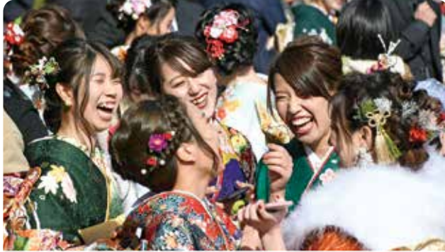
友人との久しぶりの再会に笑顔の新成人たち

令和2年成人式が市民文化会館で開催され、晴れ着姿の新成人たちが同級生や恩師との再会に笑顔を送りました。