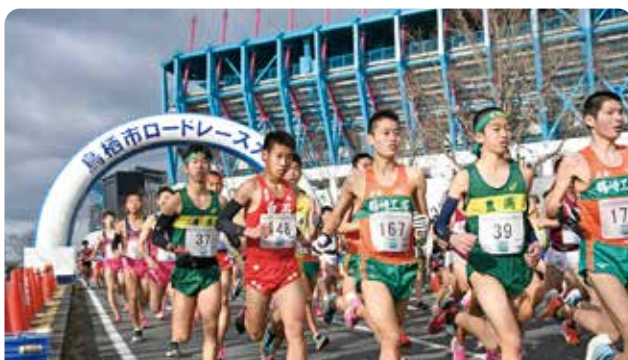
勢いよくスタートを切るランナーたち