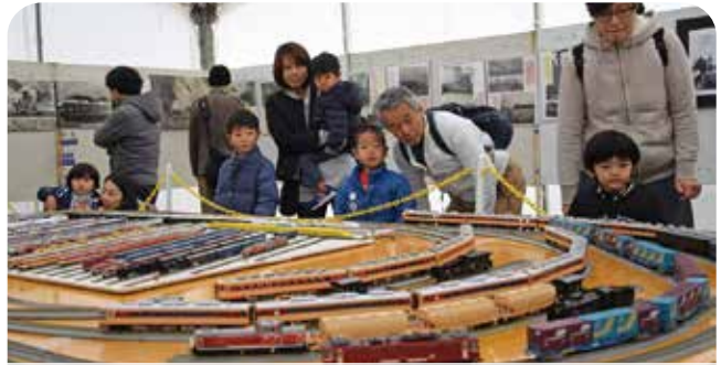
多くの親子連れや鉄道ファンでにぎわいました

鳥栖市が鉄道のまちとして発展してきた歩みを振り返る「第3回ふれあい鉄道フェスタ」がJR鳥栖駅周辺と新鳥栖駅で開催。会場では、鉄道グッズ・ジオラマの展示や268号機関車の一般公開、ミニSL・高所作業車の乗車体験など子どもから大人まで楽しめるイベントが行われました。鳥栖駅構内には「線路下のギャラリー」として鳥栖駅130年の歴史と当時の写真などが掲示されています。