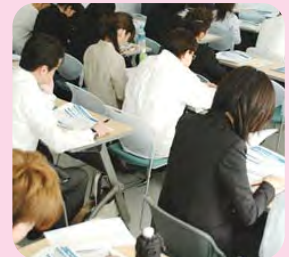
交際力を高めるための自己啓発的な講座