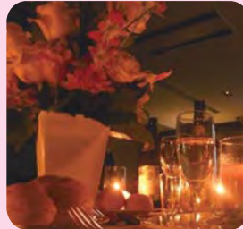
独身男女の交流を促すパーティー、食事会

出会いを希望する独身男女を対象に、イベント主催者がそれぞれの特徴を活かし、自ら企画・運営するもの