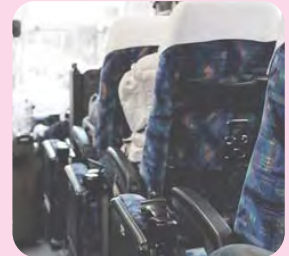
日帰りバスツアーなど