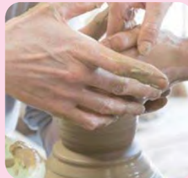
文化、スポーツまたはボランティア活動などのイベントや体験教室