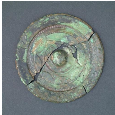
中国からもたらされた銅鏡（藤木遺跡出土）