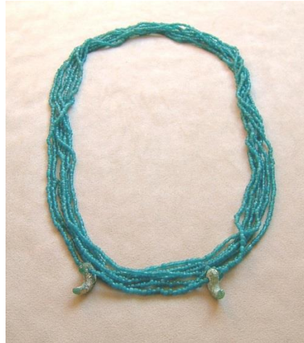
ガラス製の首飾り（内畑遺跡出土）