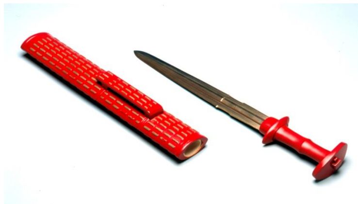
美しく装飾された短剣（柚比本村遺跡出土）復元模型