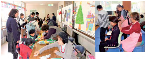
ボランティア体験コーナー