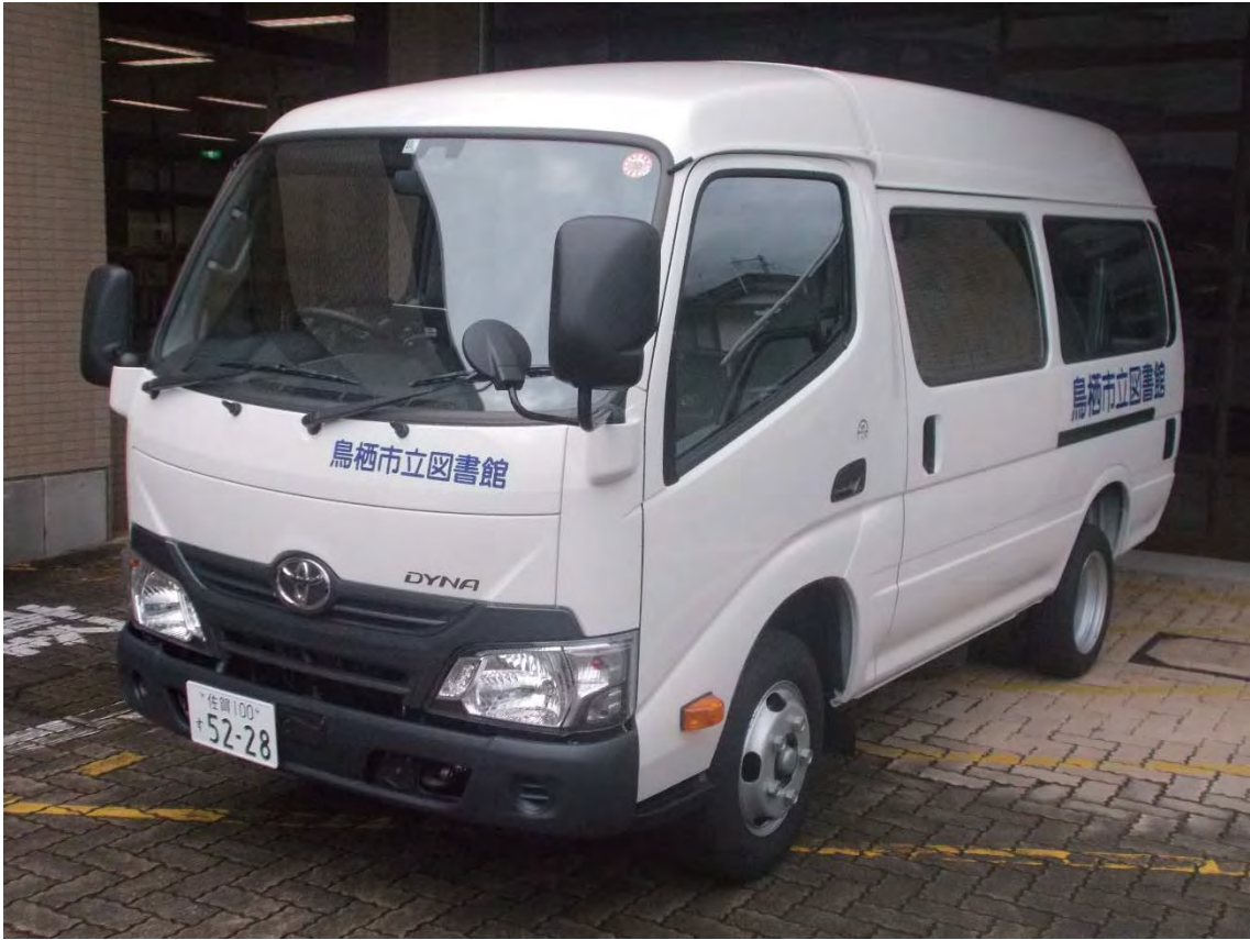
新しい移動図書館車