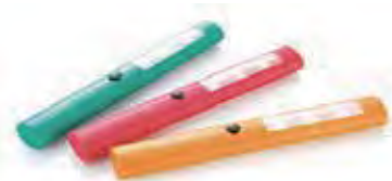
マルチスリムライト1本 ※色はお選びいただけません。