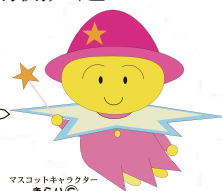
マスコットキャラクター まらひ©

とすイルミネーション実行委員会 光の応援団大募集係 TEL.0942-83-3121