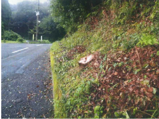
支障木伐採(通行車両の利便性向上)