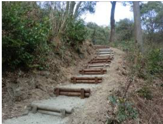
腐食した階段の整備