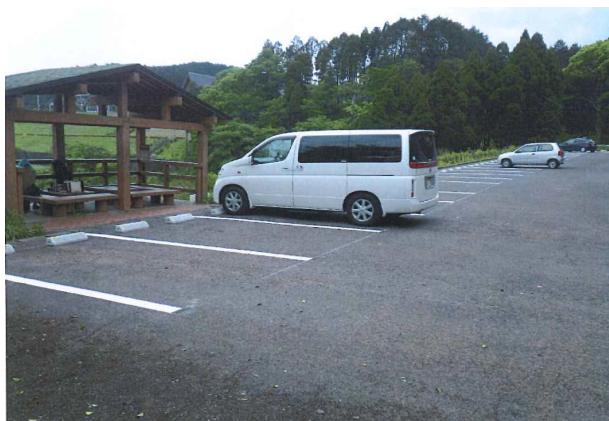
駐車場のライン引きと車止めの設置