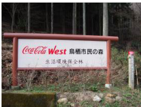
コカ・コーラウエスト鳥栖市民の森メイン看板