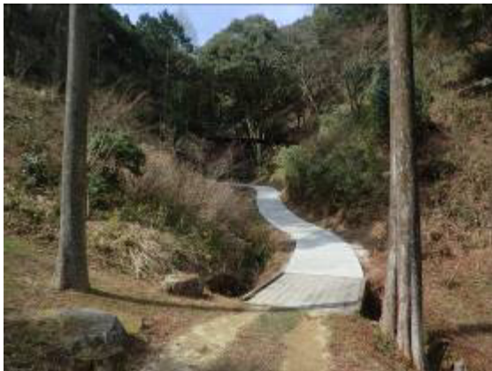
遊歩道整備により利便性の向上