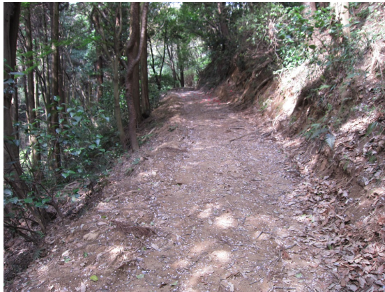
遊歩道の拡幅整地