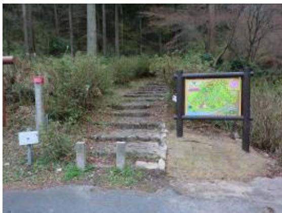
正面入り口と南入口の案内板の新設