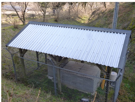
破損した屋根を補修（機能保全、景観保護）