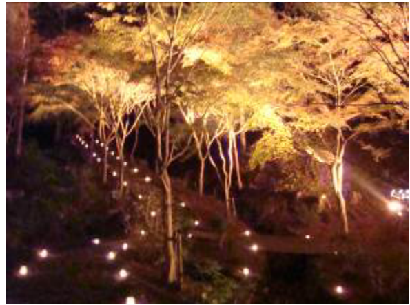
紅葉ライトアップ（平成20年度～22年度まで3年間実施）