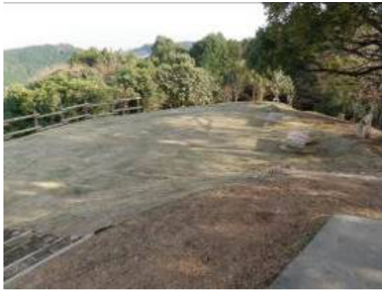
みはらしの丘の芝広場化