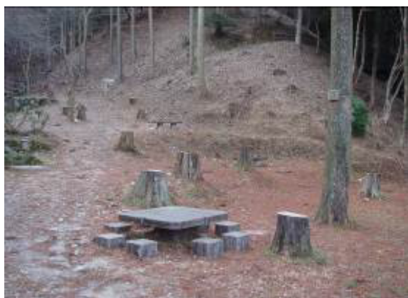
伐採により明るくなった林間広場（現芝生広場）