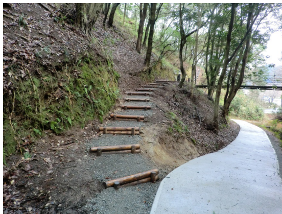
腐食階段、荒れた遊歩道の整備