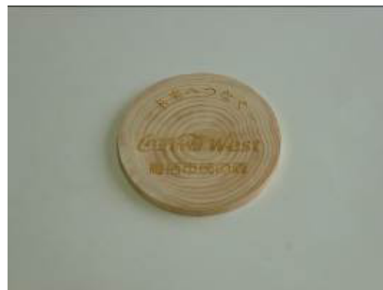
コースターを作成し、利用者へ配布