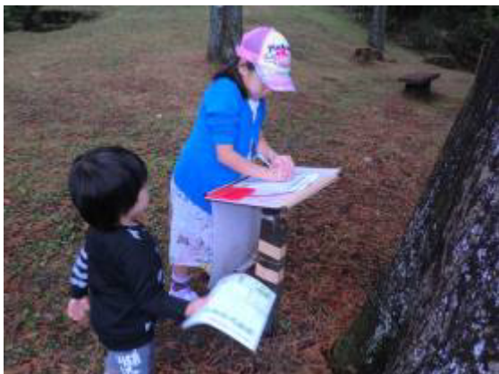
スタンプラリーや木工工作イベントの開催