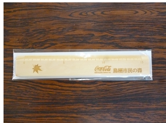
木に親しむことによる緑化啓発活動