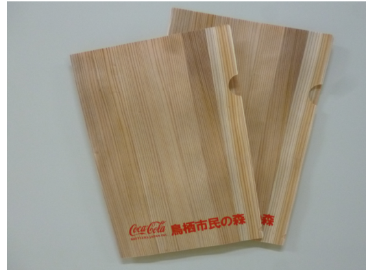
木に親しむことによる緑化啓発活動