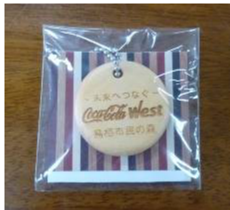
木製キーホルダーの作成