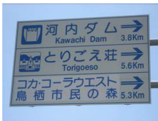
コカ・コーラウエスト鳥栖市民の森道路標識