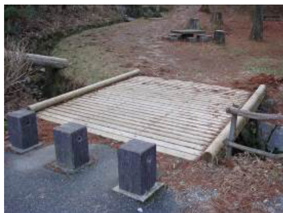
芝広場へ繋がる中央入口の橋の架け替え