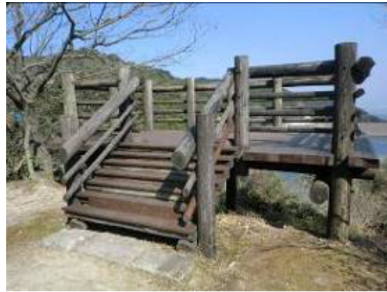
展望台床腐食部分の補修