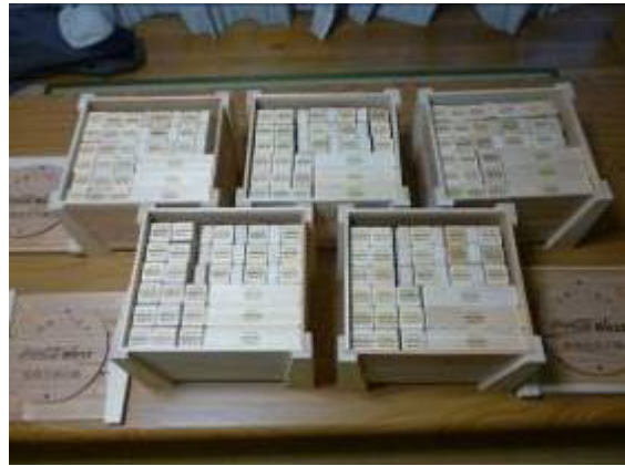
積み木を製作し、保育園、福祉施設へ寄贈