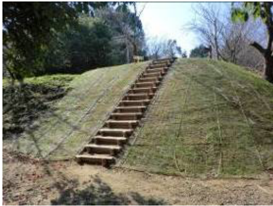
みはらしの丘からの下り階段設置