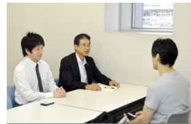
鳥栖産業支援相談室 (鳥栖Biz)