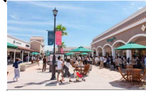
とす！トリップマルシェ (鳥栖プレミアム・アウトレット)