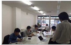
さがんみらい テレワークセンター鳥栖