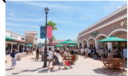
とす！トリップマルシェ (鳥栖プレミアム・アウトレット)