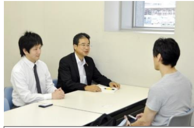
鳥栖産業支援相談室 (鳥栖ビズ)