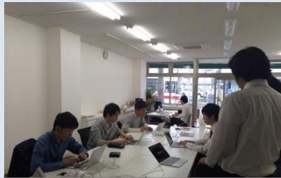
さがんみらい テレワークセンター鳥栖