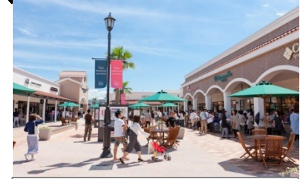
とす！トリップマルシェ (鳥栖プレミアム・アウトレット)