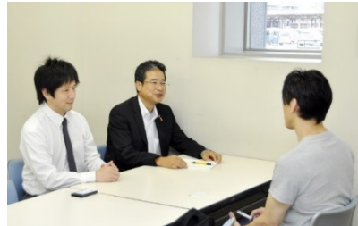
鳥栖産業支援相談室 (鳥栖ビズ)