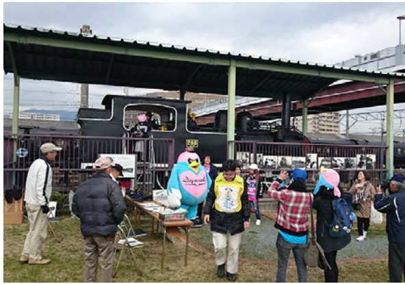
A.268号機関車一般公開

② 勝尾城筑紫氏遺跡保存整備委員会は、第1回を11月9日に開催し、保存整備事業の検討を行い、葛籠城跡地区の現地視察を行った。第2回は2月21日に開催し、葛籠城跡地区の整備基本設計について報告した。また、地元協議会を3月24日に開催し、平成28年度事業報告と平成29年度事業計画を報告した。