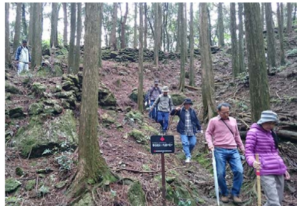
F.勝尾城筑紫氏遺跡見学会（春）