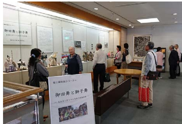
D.常設展示「御田舞と獅子舞」