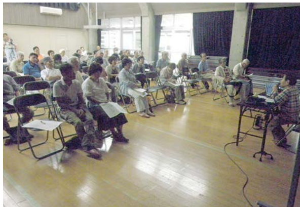
C.歴史・文化講座 現地研修