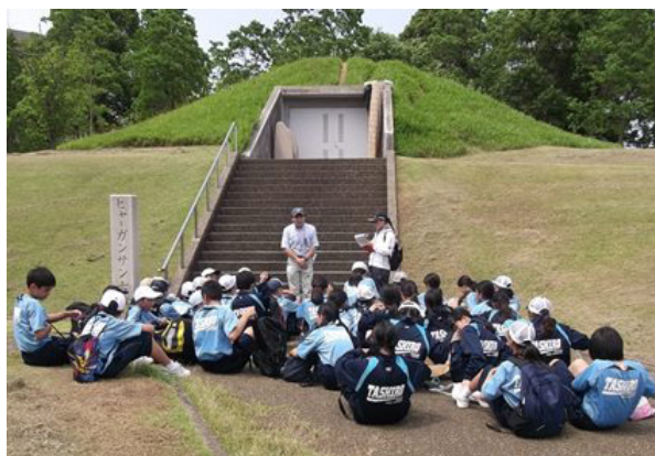
E.総合的な学習の支援