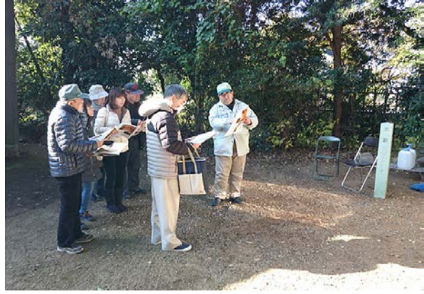
B.装飾古墳一般公開