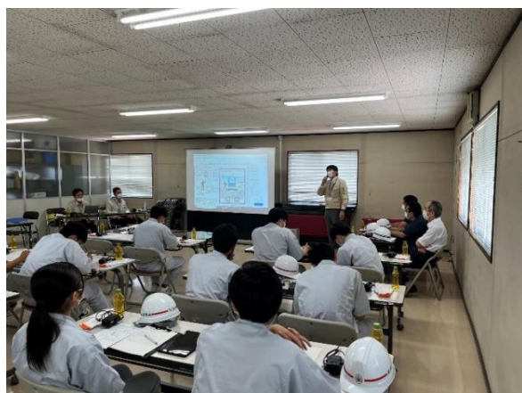
設計コンセプトの説明