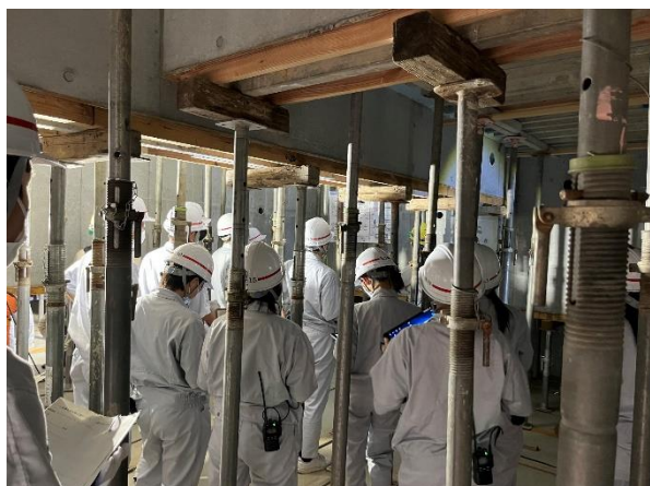
免震ピット内の見学