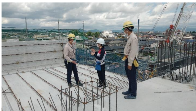
施工方法について、 熱心に質問していました