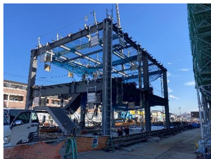
北別館の鉄骨工事をしています。